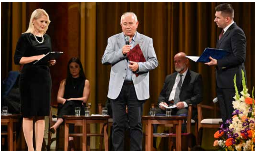
Vári Fábán László Kossuth-díjas költő az Irodalmi Tagozat közelmúltbeli tevékenységéről és további terveiről tájékoztatta a közönséget

A program során Vári Fábán László tagozatvezető arról beszélt, hogy kidolgozott egy programtervet, amely továbbra is alapját képezi a tagozatvezetői munkának. Ennek egy részét a hagyományos tagozati rendezvények (az ülések előkészítése, az Élőfolyóirat sorozat rendezvényei, az évfordulós – élő és posztumusz tagjaink ünneplésére-megemlékezésére létrejött Irodalmi Gálák, az évente megrendezendő tagozati tanulmányutak és kihelyezett, többnyire határon túli helyszíneken megvalósuló tagozati ülések) képezik, s ezekhez újabb, irodalmi életünk jeles eseményeihez kapcsolódó ren-