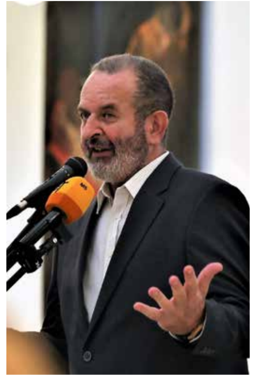
| FOTÓ: VIGH MIHÁLY

„Ha van magyar nyelv és kultúra, akkor léteznie kell kortárs magyar festészetnek is. A jellemzőiről, irányáról és az egyetemes festészetben betöltött szerepéről kell és érdemes beszélnünk. És mi lenne al-