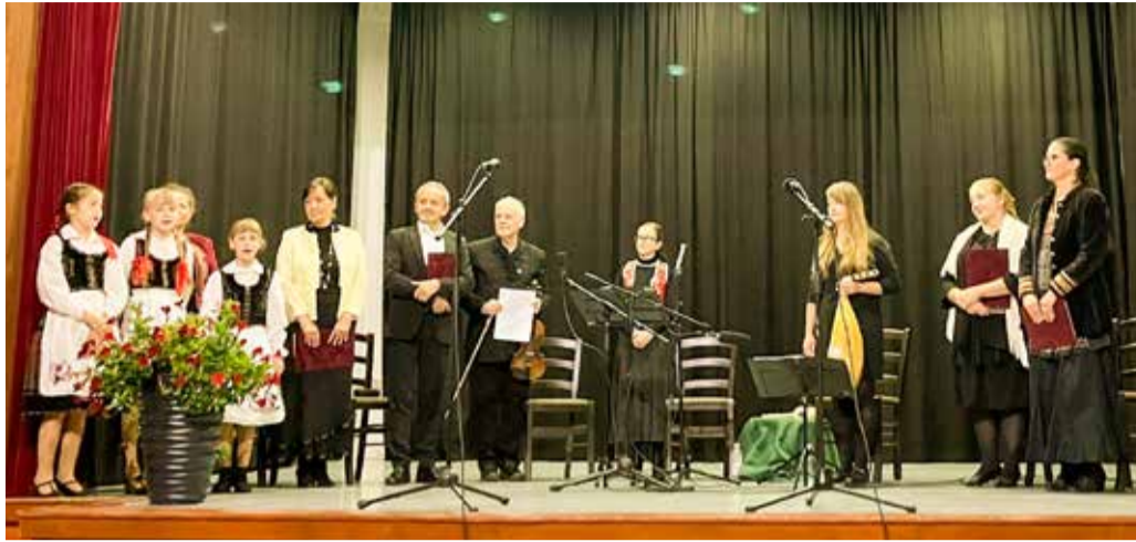
Farkaslaka lakóit pódium-émlékműsorral köszöntötte a köztestület, az összeállításban zömmel a szülőföldet megidéző Tamási-írássok hangzottak el